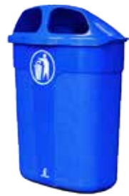
PAPERSKORG CLASSIC BLÅ

Vi kickar igång våren genom att introducera en del av vårt nya sortiment för utomhusmiljö.