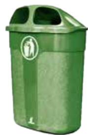
PAPERSKORG CLASSIC GRÖN