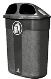
PAPERSKORG CLASSIC SVART