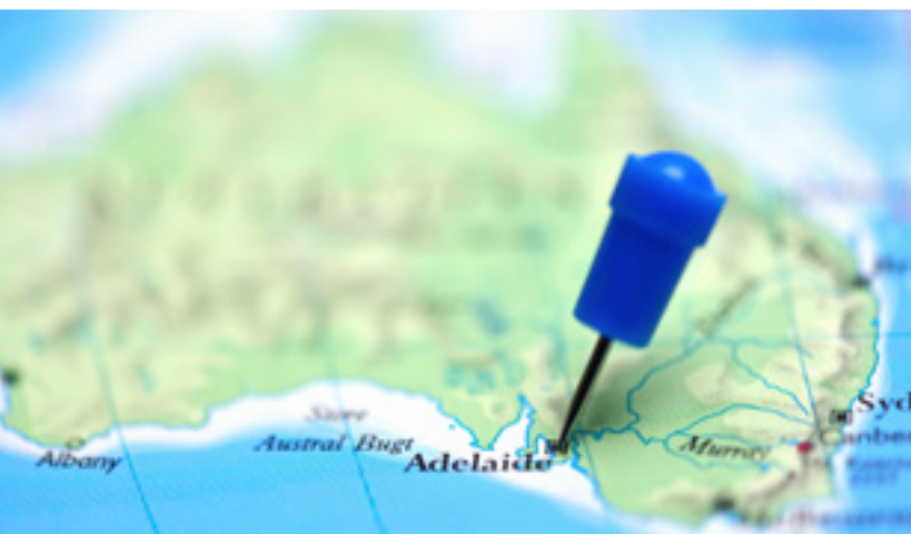
Les Wall & Drew Hoxey

”Efter större interna förändringar har vi gjort en fullständig omstrukturering av vår verksamhet. Det har varit nyttigt och dessutom bra att omgruppera teamet när det gäller vårt arbetssätt och våra affärs mål. Förändringen har verkligen varit positiv för både vårt eget team, distributörerna och kunderna – och vi ser nu fram emot ett starkt 2017!”