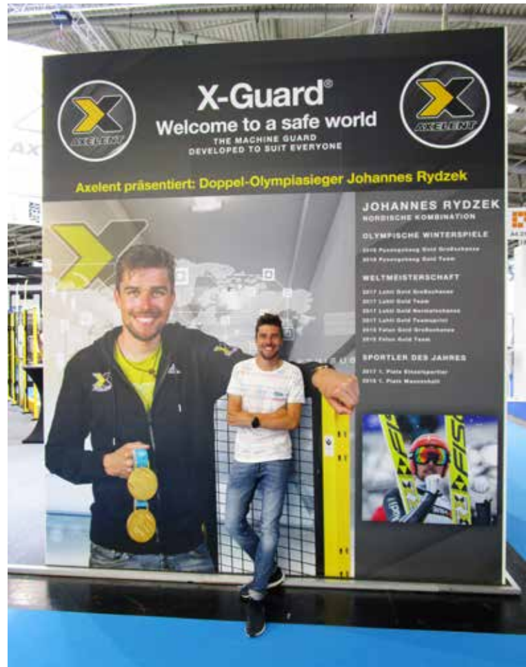
Johannes Rydzek, världsstjärna i nordisk kombination.