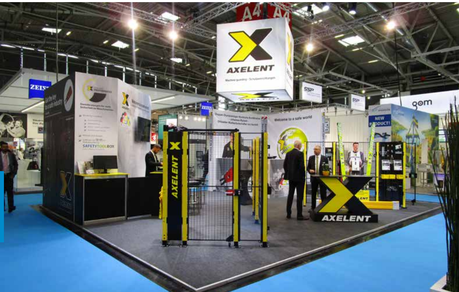
Axelents monter på Automatica.